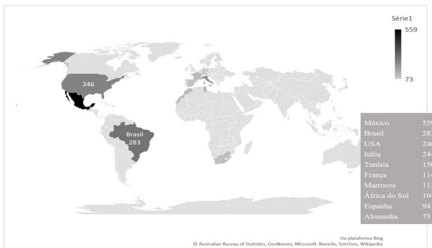
Figura 1 - Países com maior número de documentos identificados sobre a Palma forrageira.

Fonte: Elaborado pela autora (2021). Dados extraídos da base Scopus.