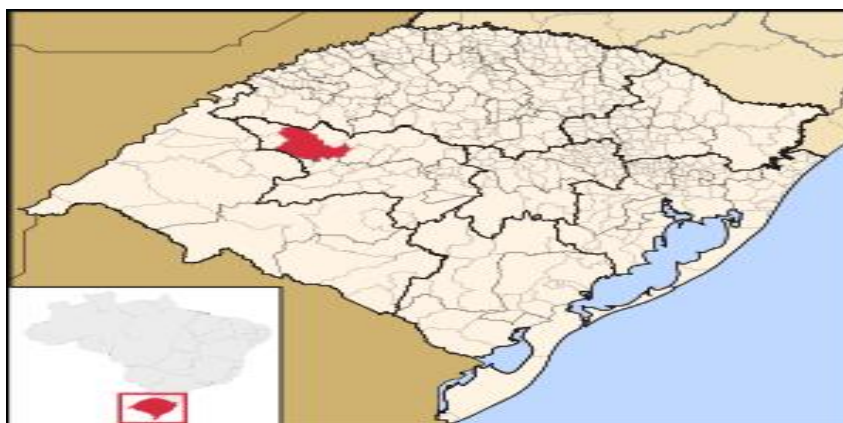
Figura 1- Mapa de ubicación de Santiago-RS.

Fuente: https://pt.wikipedia.org/wiki/Santiago_(Rio_Grande_do_Sul) , ubicación.