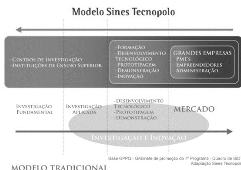
Figura 3 – Do modelo tradicional ao modelo do Sines Tecnopolo

No que se refere ao modelo de negócio do ST, ao contrário dos tecnopolos tradicionais que têm o seu foco num polo de conhecimento do ensino superior, partindo, portanto, do lado da oferta para o mercado, o Sines Tecnopolo, tem como centro de conhecimento o Ecossistema Sines, assumindo-se como o núcleo dinamizador e acelerador da atividade empresarial e empreendedora, partindo daqui em direção à oferta de investigação e inovação (figura 3).