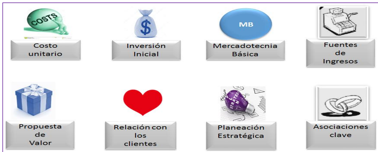
Figura 3. Modelo de negocios canvas adaptado a las mpymes de Lázaro Cárdenas

El modelo de negocios propuesto guarda un orden de acuerdo a las necesidades de información que se van ocupando para su aplicación adecuada, de igual manera puede plasmarse en un lienzo para facilitar su desarrollo, como se presenta en la figura número 3, conteniendo los datos principales, para en cada módulo desagregar la información específica mencionada y resumida en la figura número 2.