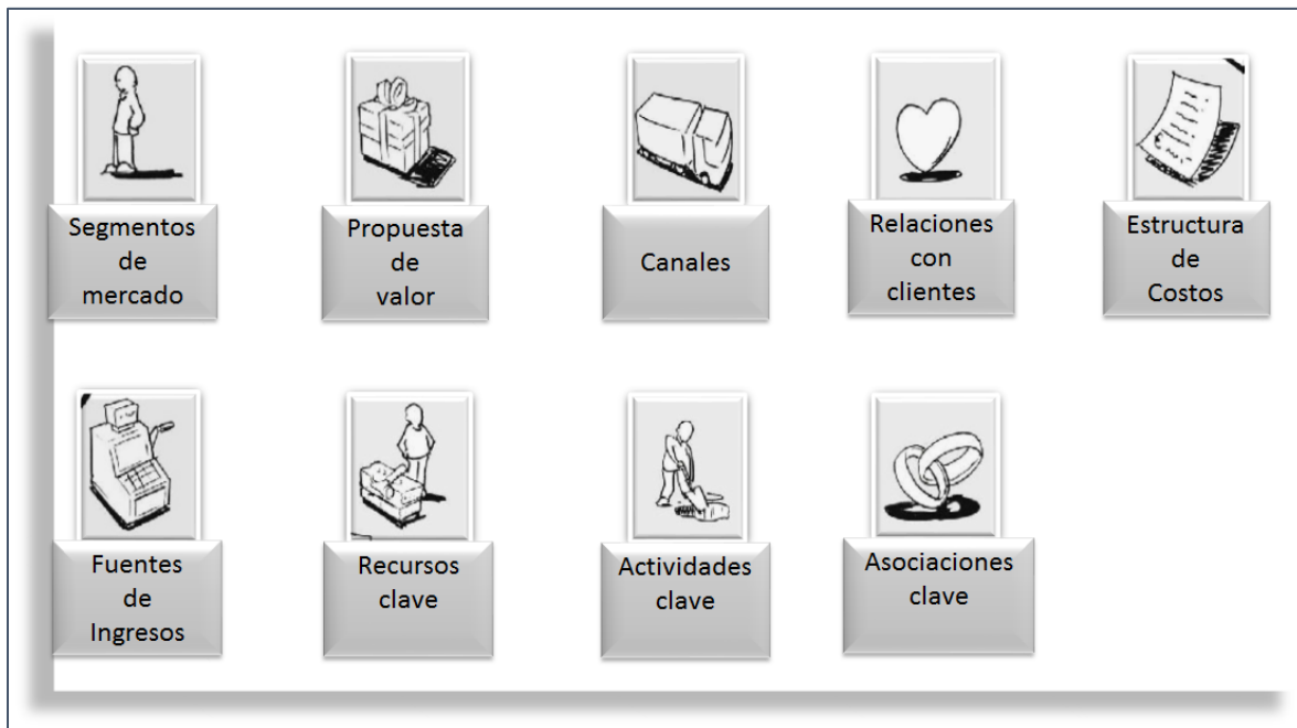
Figura 1: Los nueve módulos

Los módulos anteriores se plasman en un lienzo, con la finalidad de que los participantes puedan comentar sobre el modelo de negocio. Esta propuesta resulta sumamente práctica, sin embargo, como ya se mencionó con anterioridad, es necesario adaptarla a las mpymes de Lázaro Cárdenas, Michoacán, considerando sus características particulares y el entorno en que se desarrollan. Un punto importante que no considera esta propuesta, es la relativa a la inversión inicial, información necesaria para proyectos de nuevas empresas, así mismo es importante considerar la planeación estratégica a fin de identificar el rumbo de la organización. Otro punto relevante a considerar, es la determinación del costo unitario, por ser el punto de partida de un precio de venta competitivo, se menciona la estructura de los mismos, sin embargo no se precisa su integración.